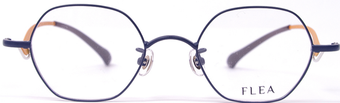
Col:1 Brown & Yellow